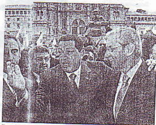
El presidente venezolano, a su llegada a Galicia.

Chávez asistió a la firma de tres acuerdos de colaboración con el Gobierno gallego y otro con el Ayuntamiento de Santiago.