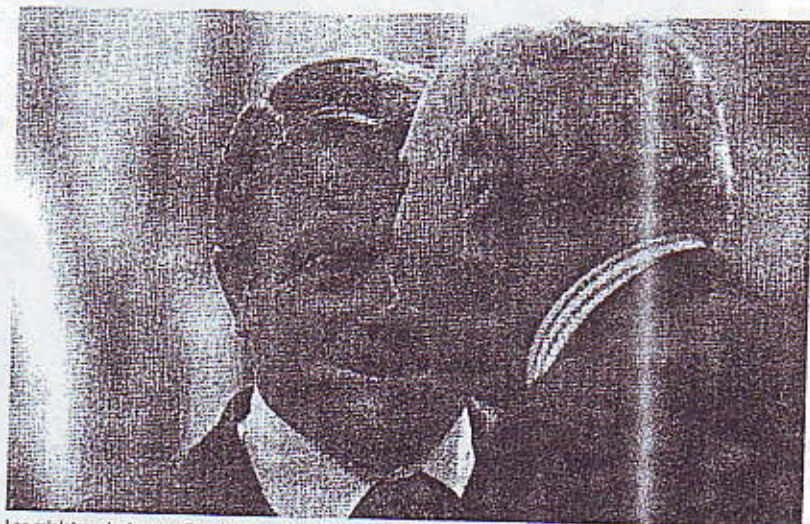
Los ministros de Asuntos Exteriores de Cuba y España conversan durante la cumbre.

También Cuba junto a Venezuela lograron que prosperara un "comunicado especial" sobre terrorismo. En él se da un apoyo explícito a las gestiones para obtener "la extradición o llevar ante la justicia al responsable del atentado terrorista a un avión de Cubana de Aviación en octubre de 1976" que causó la muerte de 73 civiles, así como al presunto responsable, el antecesorista Luis Posada Carriles, detenido en Estados Unidos. La continuidad de ambas declaraciones es inusual en