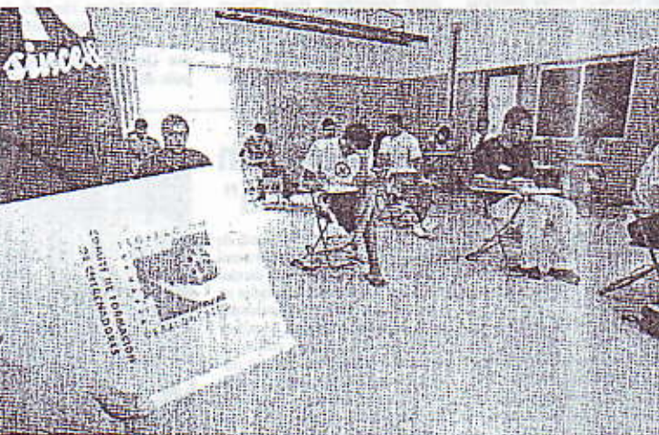
La Federación no para. Si el viernes firmaba un convenio con Islas Airways (imagen superior), el sábado examinaba a los futuros entrenadores de primer nivel. JUAN GARCÍA CRUZ (ACAN)